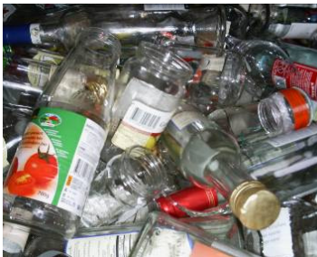
Figura 10: Botellas de vidrio de origen domiciliario