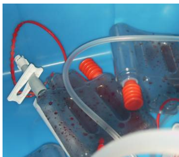
Figura 17: Residuos hospitalarios infecciosos