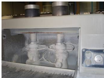
Figura 16: Lodo del esmerilado (pulido) de lentes ópticos