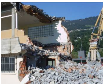
Figura 5: Residuos de concreto y ladrillos desde una demolición