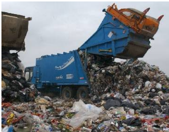
Figura 1: Residuos de origen domiciliario