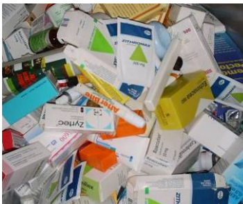
Figura 14: Medicamentos vencidos