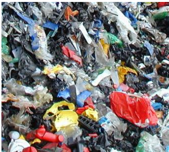
Figura 7: Residuos plásticos de embalaje, botellas PET, etc.