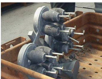
Figura 8: Residuos de arena de una fundición