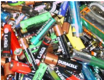
Figura 13: Baterías desechadas de origen domiciliario