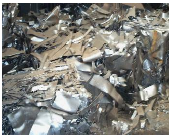
Figura 4: Despuntes de metal de la industria mecánica