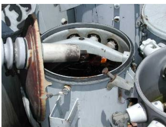
Figura 2: Aceite de transformadores eléctricos, que contiene bifenilos policlorados